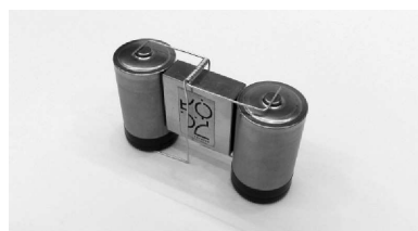
Fot. 2. Wygląd zbudowanej huśtawki elektrodynamicznej

Sposób wykonania elektrodynamicznej huśtawki przedstawia rysunek 2. W tym układzie dwie baterie alkaliczne typu R20 są przyłożone do przeciwnych ścianek używanego poprzednio prostokątnego magnesu neodymowego. Na magnes nałożony jest wspornik z tulejką, w części środkowej wygięty z drutu miedzianego. Wykonując tulejkę i wspornik, należy postępować w sposób podobny jak poprzednio. Dolne końce wspornika zostały zagięte pod kątem prostym i dotykają od spodu ujemnych biegunów baterii. Przez tulejkę wspornika przechodzi poziome ramię zagięte dwukrotnie pod kątem prostym, dzięki temu jego końcówki mogą dotykać do dodatnich biegunów baterii. Wysokość wspornika jest nieco większa niż wysokość baterii. Skutkiem tego w dowolnej chwili tylko jedna końcówka ramienia po jego przechyleniu może dotykać baterii. Jeden ze zbudowanych modeli huśtawki pokazano na fotografii 2.