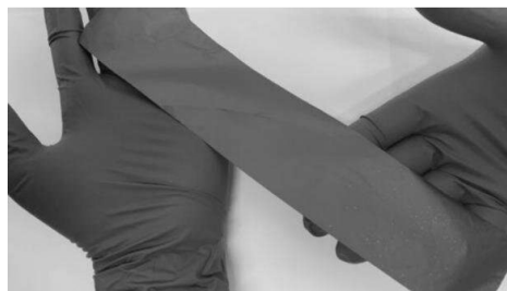
Rys. 4. Warstwa z MXenes do ekranowania fal elektromagnetycznych

Przykładowo dołączenie grup fluorowych, hydroksylowych lub tlenowych do związku Ti 2 CO 2 daje mu wytrzymałość na rozciąganie przewyższającą tę dla grafenu, a także zwiększenie elastyczności. Inną ciekawą cechą tej grupy związków jest osiąganie niespotykanej dotychczas efektywności ekranowania promieniowania elektromagnetycznego w stosunku do innych materiałów 2D. Raportuje się, że niektóre MXenes ekranują promieniowanie EM na poziomie 92 dB, a to oznacza, że co najmniej 99,9999994% padającego promieniowania jest blokowanych przez materiał. Jest to bardzo obiecująca wartość, szczególnie biorąc pod uwagę ewentualne zastosowania w nanokompozytach polimerowych. Na rysunku 4 przedstawiono warstwę wykonaną z MXenes, przeznaczoną do zastosowania w ekranowaniu fal EM.