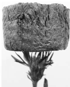
Rys. 2. Aerożel grafenowy, który przy odpowiedniej metodzie produkcji może być lżejszy od powietrza, a mimo to jest w stanie zaabsorbować wodę o masie przekraczającej 850-krotność swojej własnej. Dlatego można go wykorzystać między innymi jako materiał służący do oczyszczania środowiska, ale także do magazynowania energii.

Andre Geim (razem z Michaeliem Berrym) otrzymał w 2000 roku Nagrodę Ig Nobla za eksperyment, w którym żywa żaba lewitowała w silnym polu magnetycznym. Andre Geim jest jak dotąd jedynym laureatem obydwu nagród: Nobla oraz Ig Nobla.