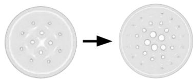
Rys. 1. Kondensat z wirami – widok z góry. Przechodzimy z wolno obracającego się układu (lewa strona) do układu obracającego się szybciej (prawa strona). Liczba wirów, widocznych jako białe, puste przestrzenie, ulega zwiększeniu

Zastanówmy się, co się stanie, jeżeli kondensat Bosego-Einsteina zaczniemy mieszać. Nasza intuicja wskazuje na to, że w układzie wytworzy się wir. Nie zawiedzie nas ona, bo ten wir zobaczymy. W dodatku niejeden. Im szybciej ten układ mieszamy, tym więcej wirów widzimy w naszym kondensacie (por. rys. 1).